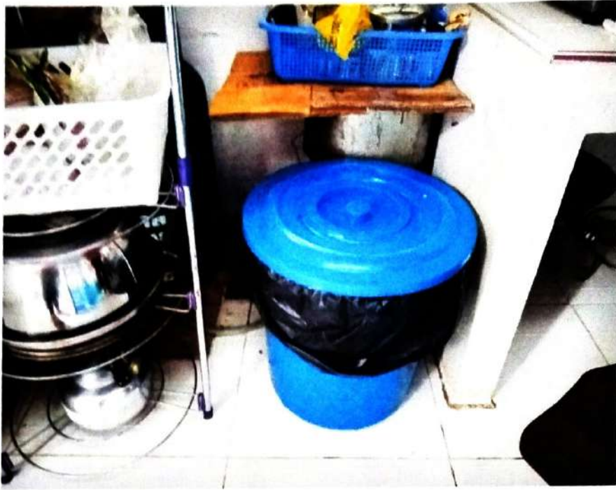
ภาพที่ ๗ การตรวจที่รองรับขยะมูลฝอย