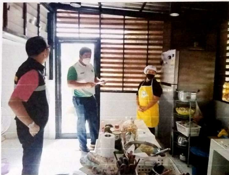
ภาพที่ ๒ การแนะนำเกณฑ์มาตรฐานสถานที่จำหน่ายอาหารและสถานที่สะสมอาหาร