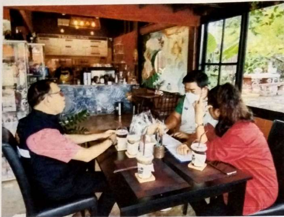
ภาพที่ ๑ การตรวจเช็คเอกสาร เรื่อง สถานที่จำหน่ายอาหารและสถานที่สะสมอาหาร