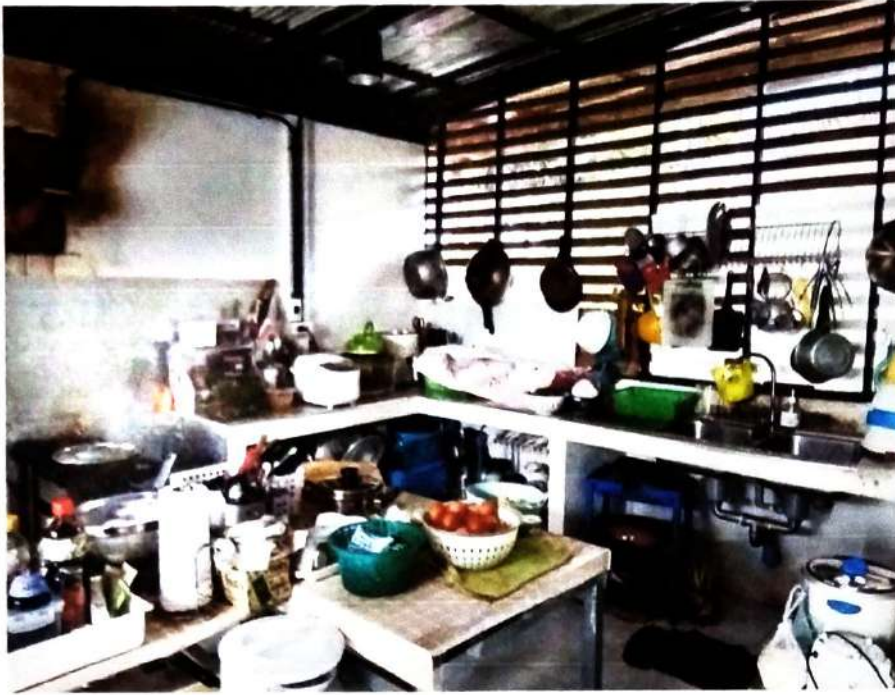
ภาพที่ ๕ การตรวจสอบสถานที่วางอุปกรณ์ เครื่องปรุงและการเก็บอาหาร