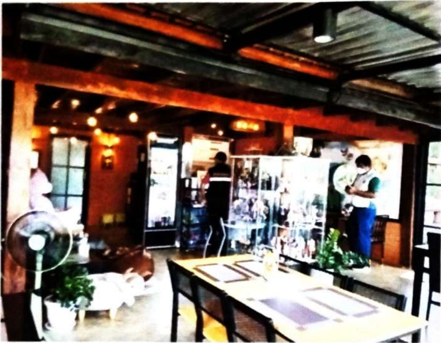
ภาพที่ ๙ การตรวจสอบสถานที่จำหน่ายอาหาร