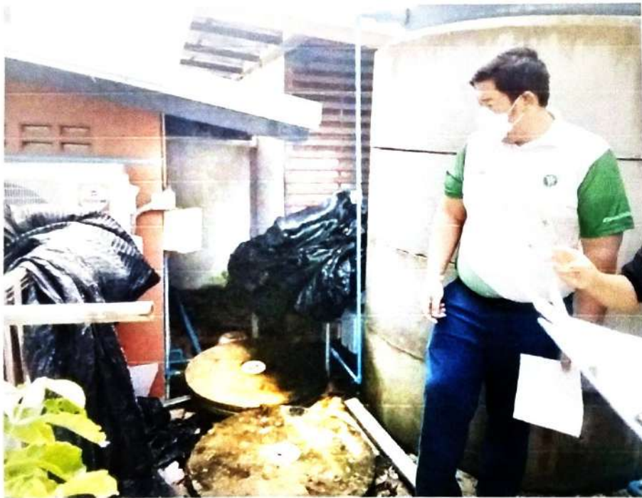
ภาพที่ ๖ การตรวจสอบอัดักไขมันและระบบการระบายน้ำเสีย