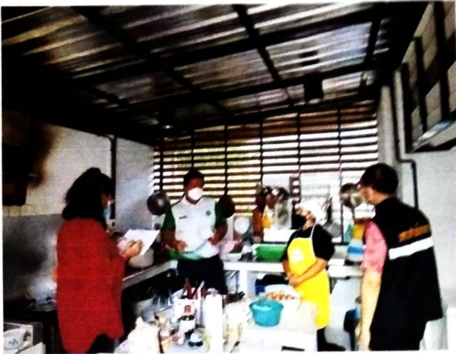
ภาพที่ ๓ การตรวจสอบสถานที่สะสมอาหารโซนประกอบอาหาร