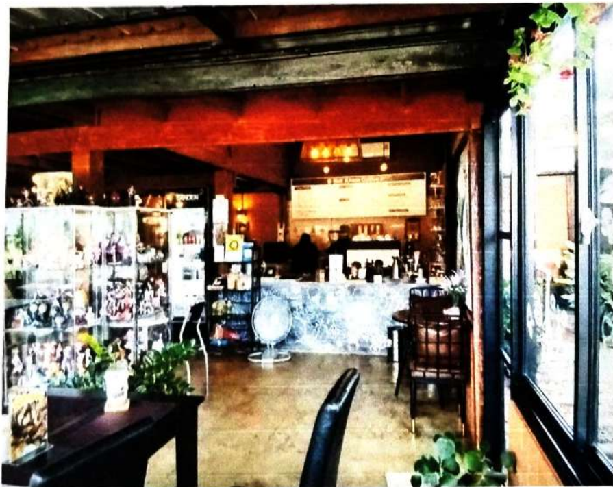
ภาพที่ ๘ การตรวจสถานที่จำหน่ายอาหาร