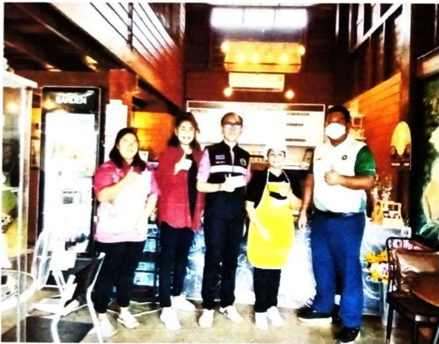
ภาพที่ ๑๐ การตรวจสอบสถานที่จำหน่ายอาหาร