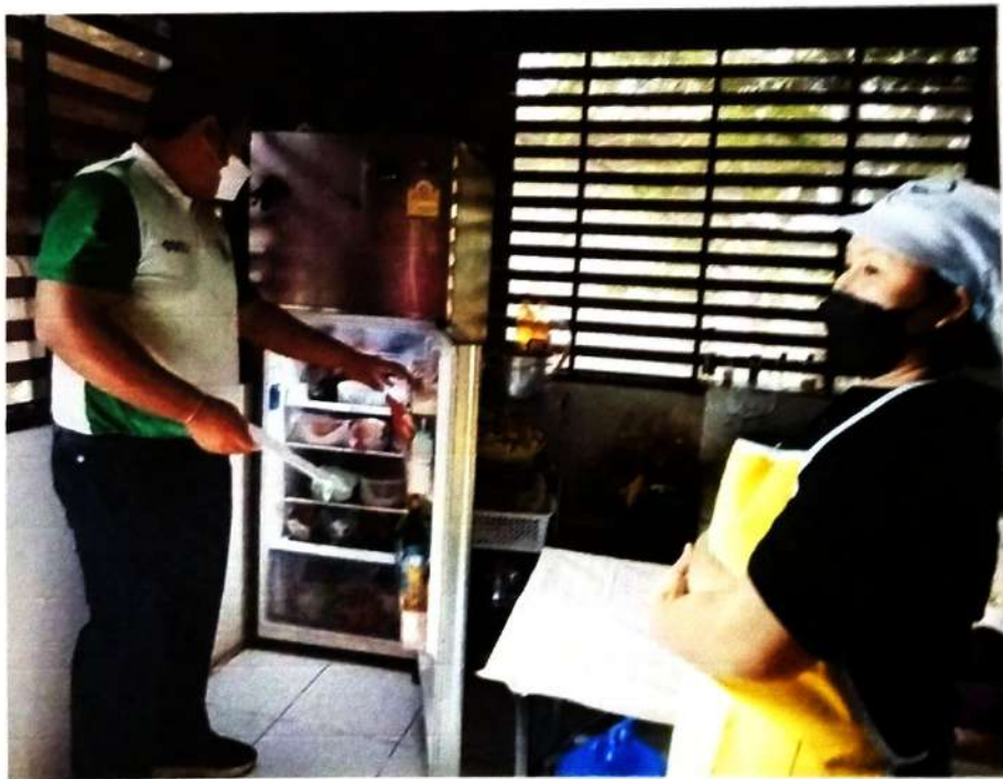
ภาพที่ ๔ การตรวจสอบสถานที่สะสมอาหารโซนประกอบอาหาร