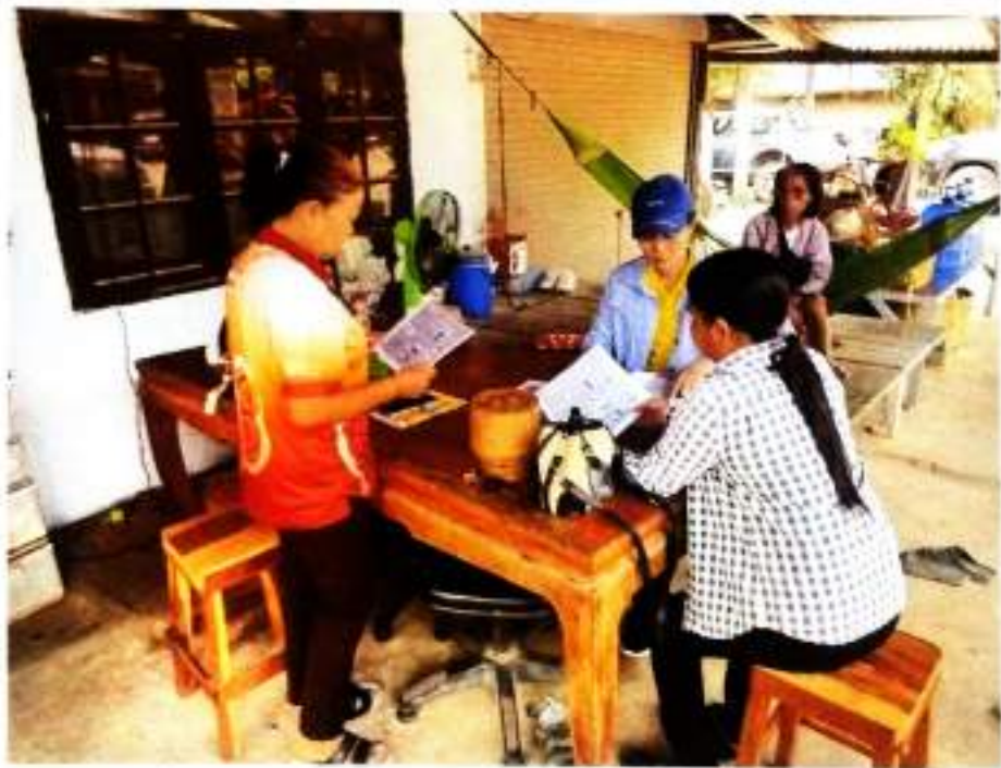
ภาพที่ ๑๐ ให้ความรู้เกี่ยวกับการใช้งานถังขยะเปียก บ้านห้วยทับนาย