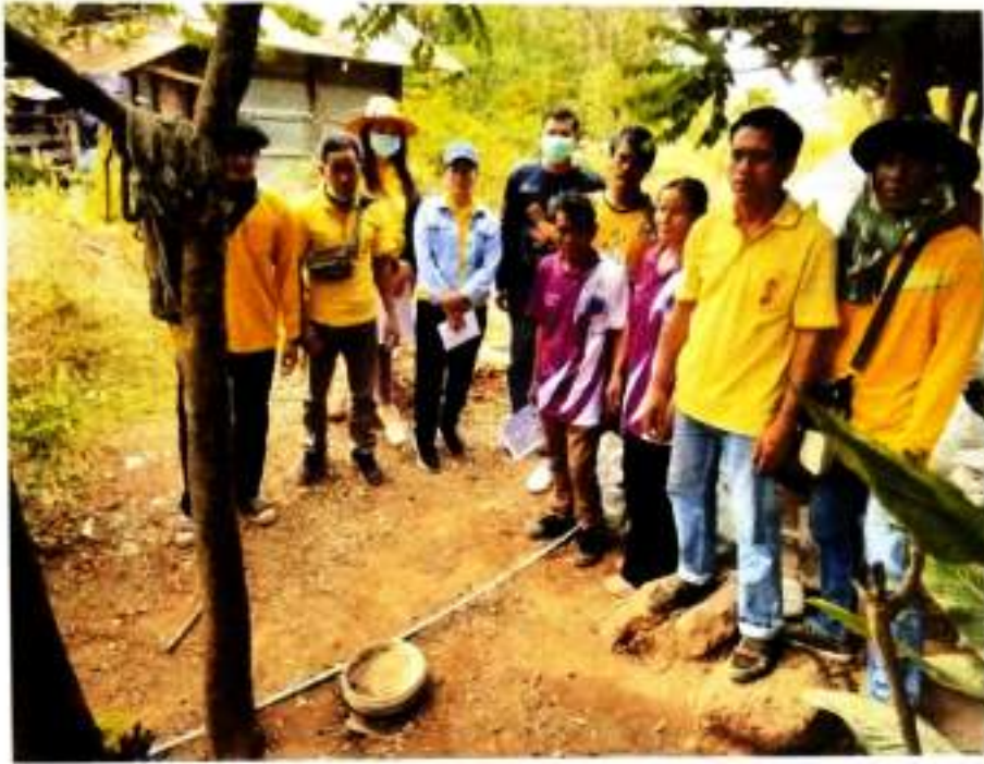
ภาพที่ ๕ ลงพื้นที่เก็บข้อมูลเตรียมการรับรองปริมาณก๊าซเรือนกระจกฯ บ้านตอนกอก