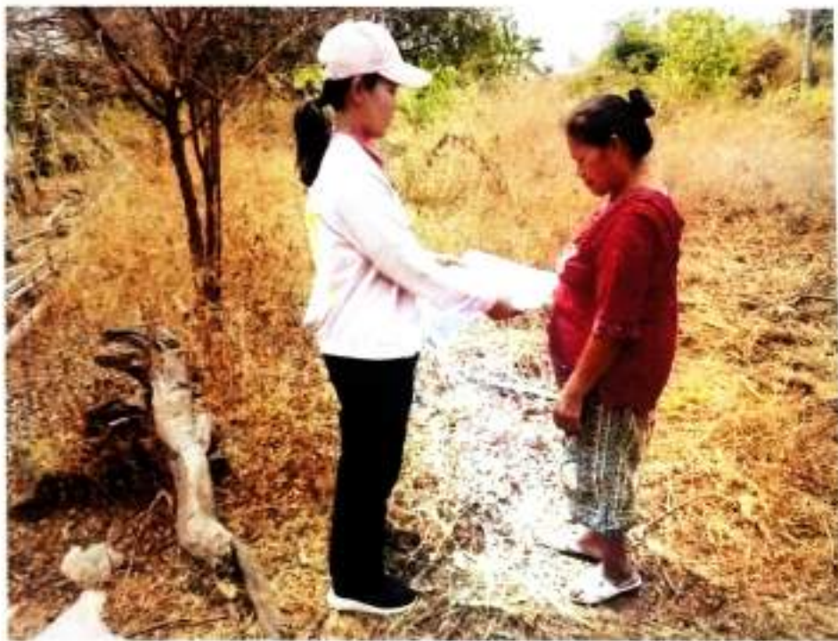
ภาพที่ ๑๖ ให้ความรู้เกี่ยวกับการใช้งานถังขยะเปียก บ้านภูเขาทอง