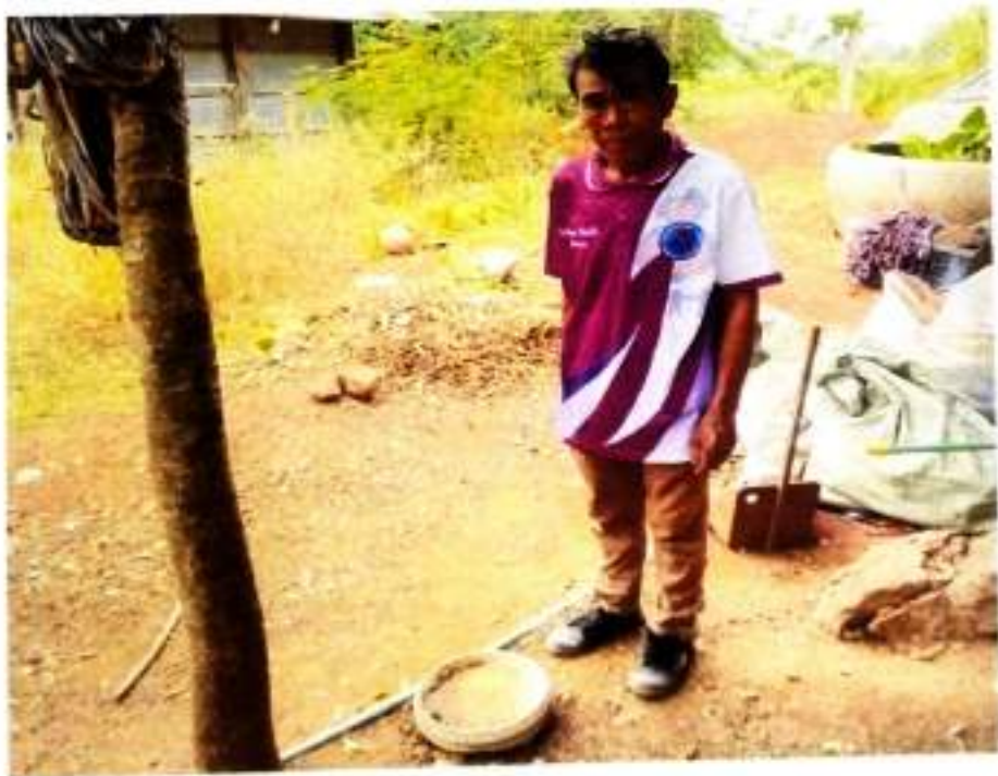
ภาพที่ ๖ ให้ความรู้เกี่ยวกับการใช้งานถังขยะเปียก บ้านตอนกอก