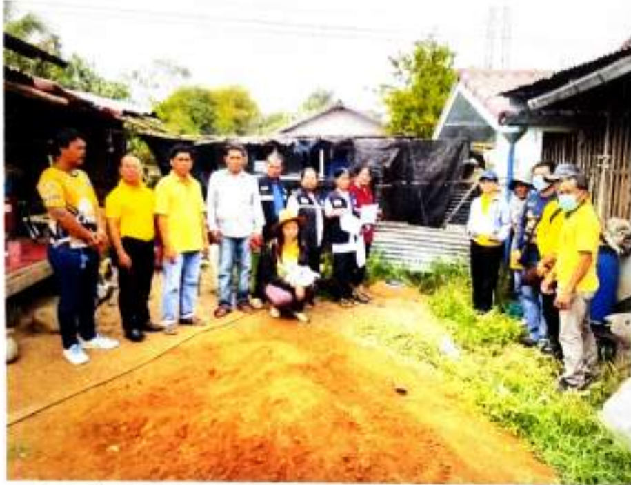
ภาพที่ ๑ ลงพื้นที่เก็บข้อมูลเตรียมการรับรองปริมาณก๊าซเรือนกระจกฯ บ้านหนองจาน