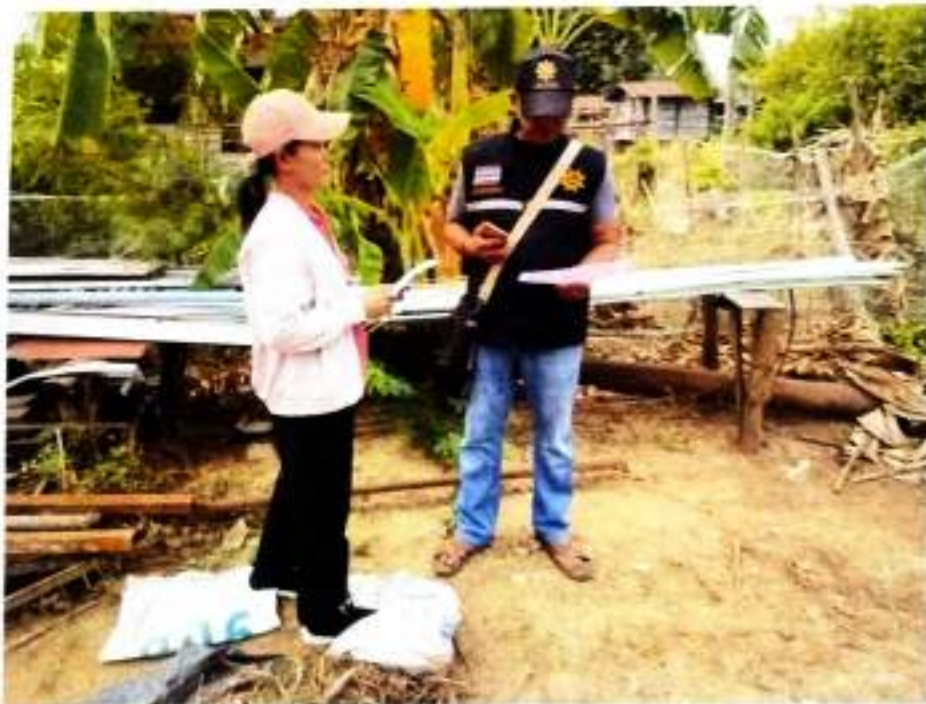
ภาพที่ ๑๒ ให้ความรู้เกี่ยวกับการใช้งานถังขยะเปียก บ้านหนองม่วง