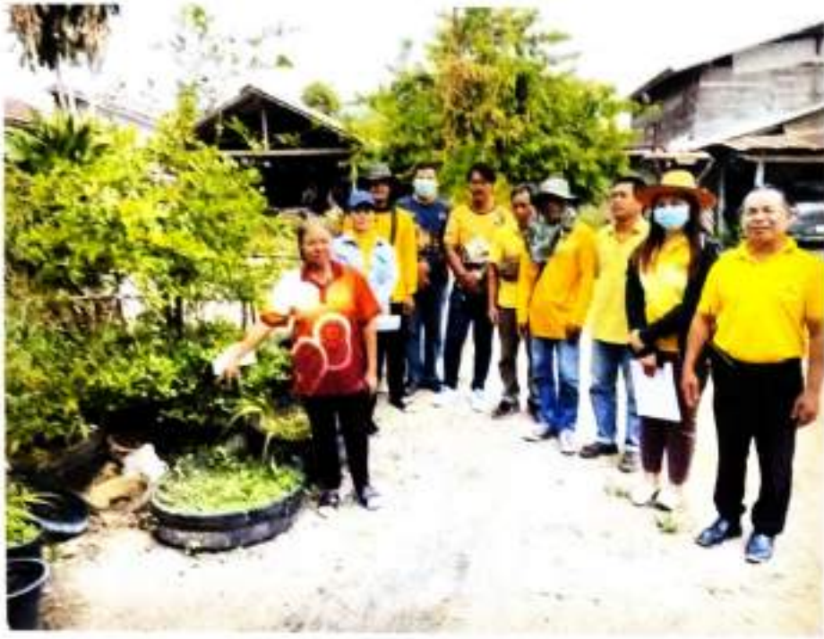
ภาพที่ ๙ ลงพื้นที่เก็บข้อมูลเตรียมการรับรองปริมาณก๊าซเรือนกระจกฯ บ้านห้วยทับนาย