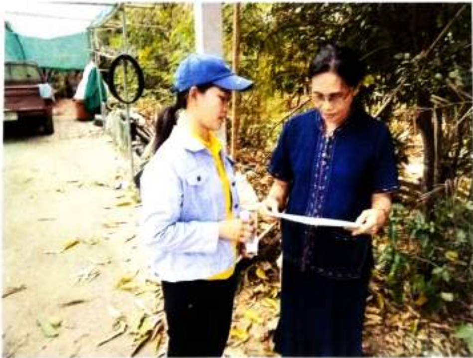
ภาพที่ ๔ ให้ความรู้เกี่ยวกับการใช้งานถังขยะเปียก บ้านละหานค่าย