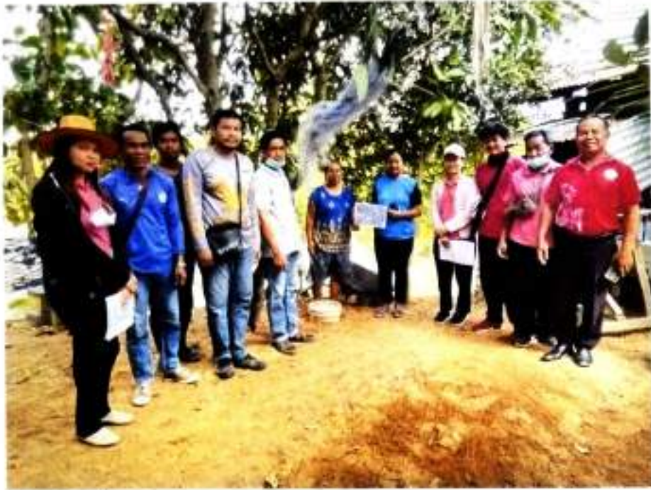
ภาพที่ ๑๓ ลงพื้นที่เก็บข้อมูลเตรียมการรับรองปริมาณก๊าซเรือนกระจกฯ บ้านตะลอมใต้