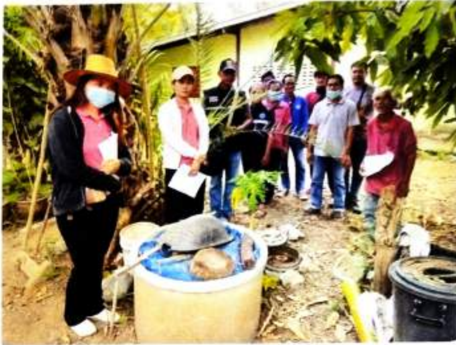
ภาพที่ ๑๑ ลงพื้นที่เก็บข้อมูลเตรียมการรับรองปริมาณก๊าซเรือนกระจกฯ บ้านหนองม่วง