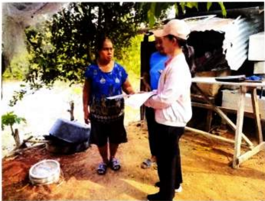
ภาพที่ ๑๔ ให้ความรู้เกี่ยวกับการใช้งานถังขยะเปียก บ้านตะลอมใต้