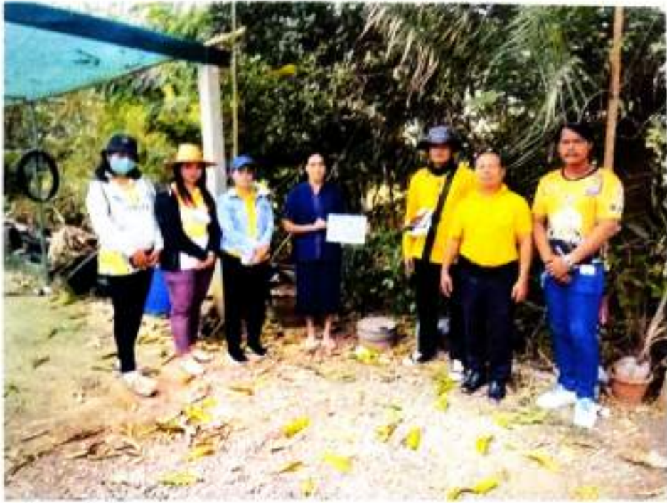
ภาพที่ ๓ ลงพื้นที่เก็บข้อมูลเตรียมการรับรองปริมาณก๊าซเรือนกระจกฯ บ้านละหานค่าย