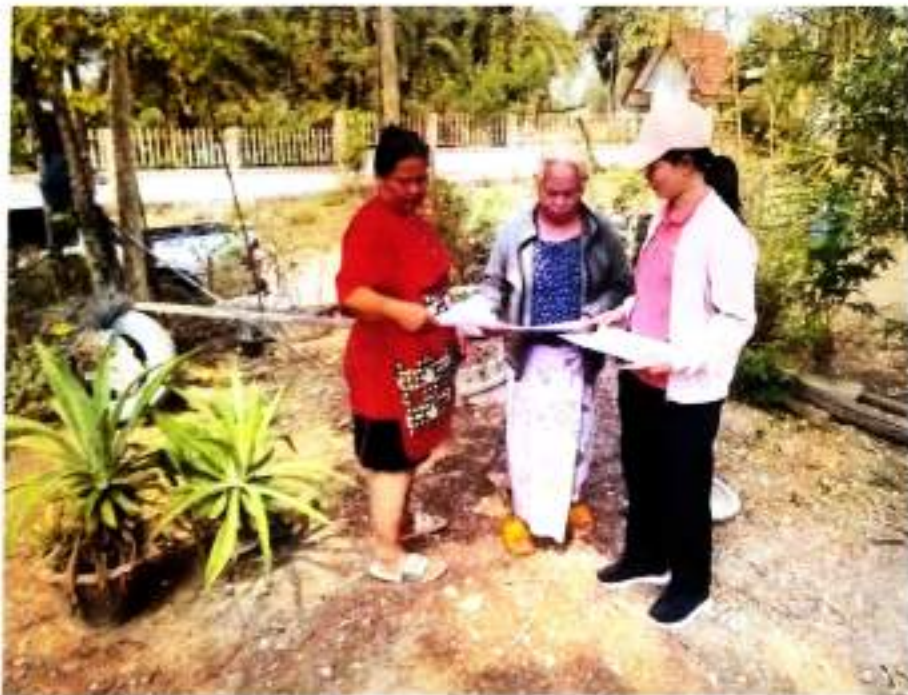
ภาพที่ ๓๘ ให้ความรู้เกี่ยวกับการใช้งานถังขยะเปียก บ้านโคกสะอาด