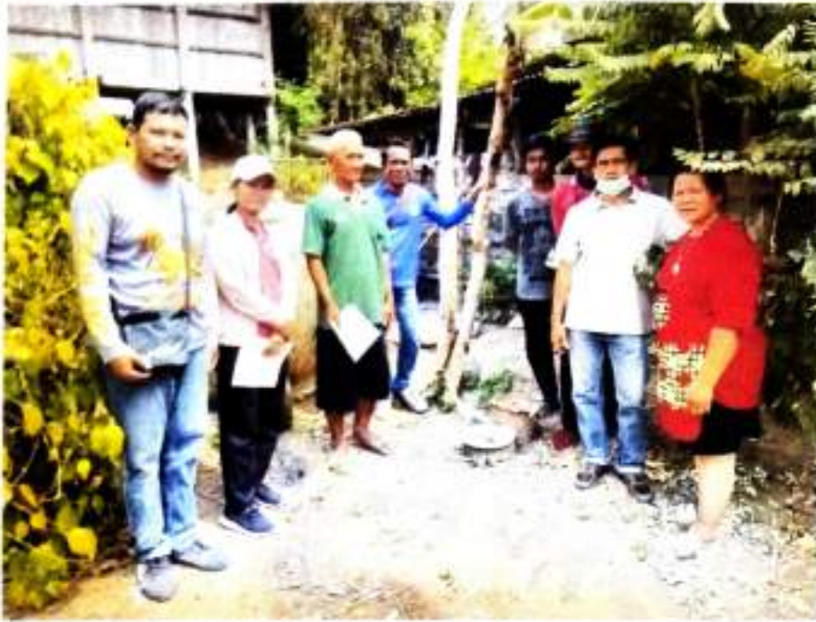
ภาพที่ ๓๗ ลงพื้นที่เก็บข้อมูลเตรียมการรับรองปริมาณก๊าซเรือนกระจกฯ บ้านโคกสะอาด