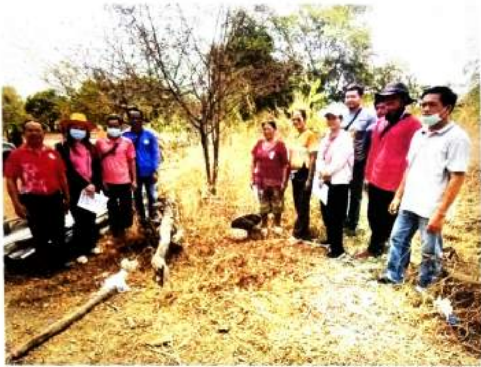
ภาพที่ ๑๕ ลงพื้นที่เก็บข้อมูลเตรียมการรับรองปริมาณก๊าซเรือนกระจกฯ บ้านภูเขาทอง