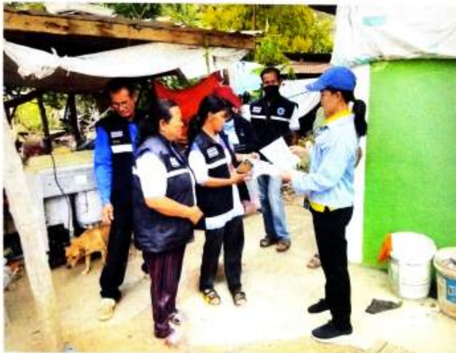
ภาพที่ ๒ ให้ความรู้เกี่ยวกับการใช้งานถังขยะเปียก บ้านหนองจาน